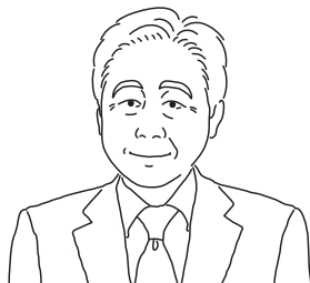
INPIT 秋田県知財総合支援窓口