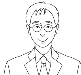
総合企画部 知財・デザイン支援課