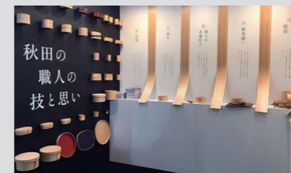
株式会社大館工芸社『展示ブース』