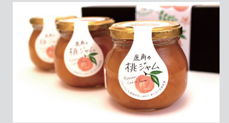
レディースファーム『鹿角の桃ジャム』