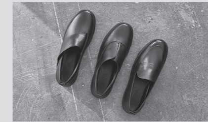
株式会社ユーイーアイ『SEAM.SHOES』